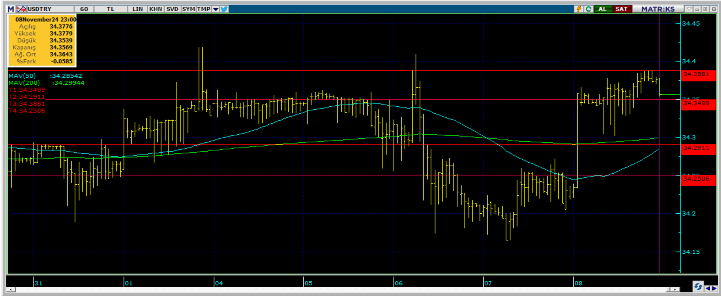
Destek Direnç Seviyeleri ve Pivot Değeri