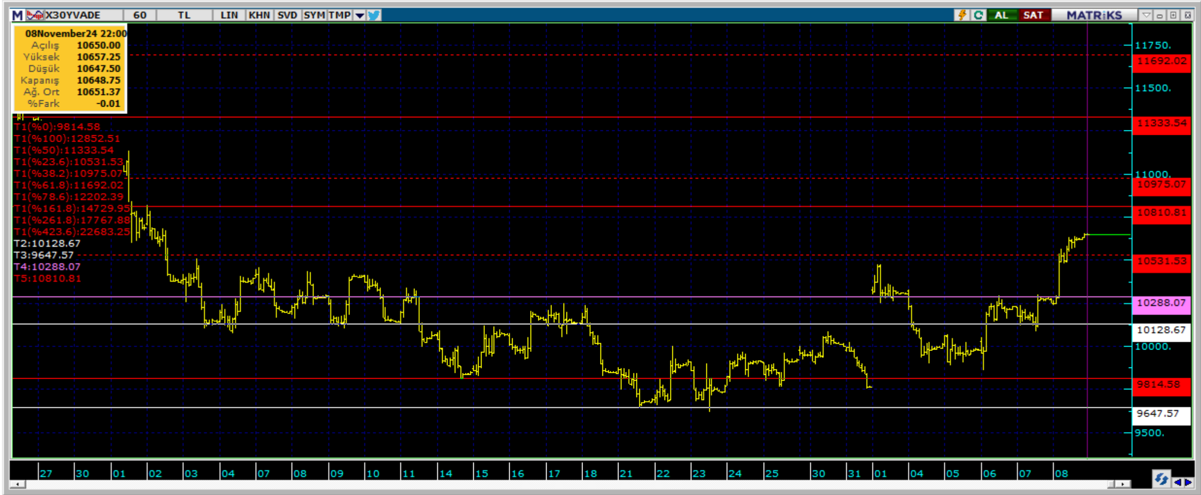
Destek Direnç Seviyeleri ve Pivot Değeri